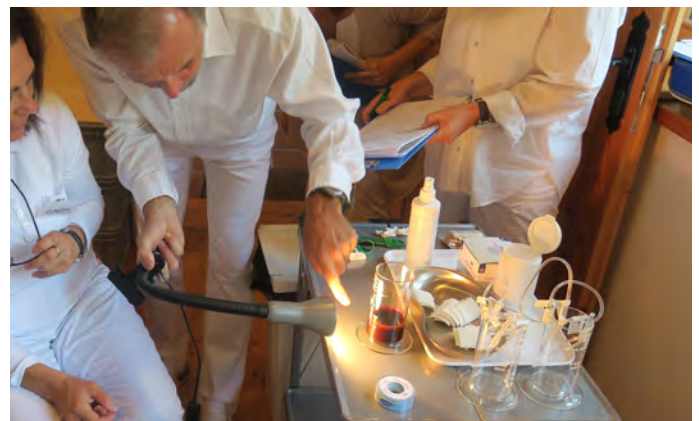
Abb. 2: Die Vital-Befundung des Blutes