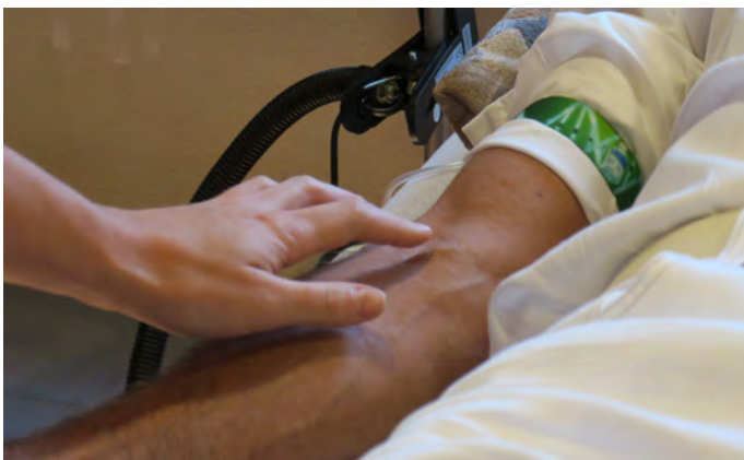
Abb. 1: Venen-Tastbefundung